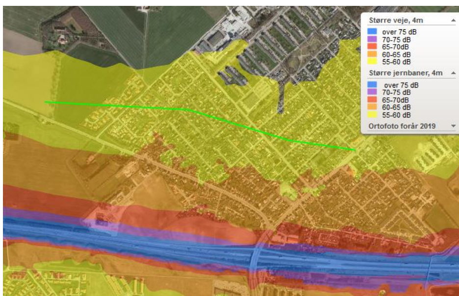
Figur 1: Støjudbredelsen fra motorvejen ved Kaserneområdet. Den grønne streg marker ca. 58 dB.

Når der foreligger en vedtaget lokalplan og en miljøvurdering for området, skal der udarbejdes myndighedsgodkendelser inden anlægsfase. Der forventes godkendelse af en lokalplan i 2020. Hvorefter ansøgning om myndighedsgodkendelser og anlæggelse af volden skal varetages af en privat aktør i henhold til Byrådets beslutning den 11. juni 2019.