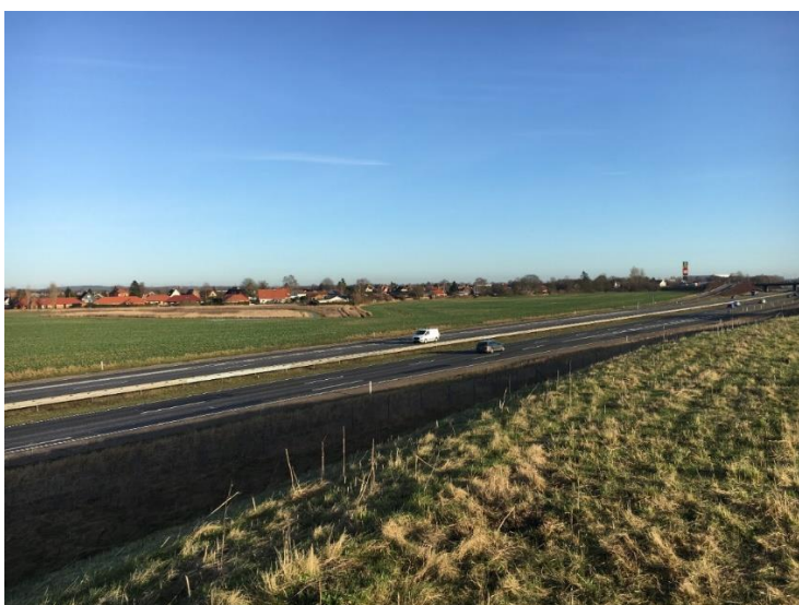
Figur 2: Område for støjvold set fra Ringsted siden