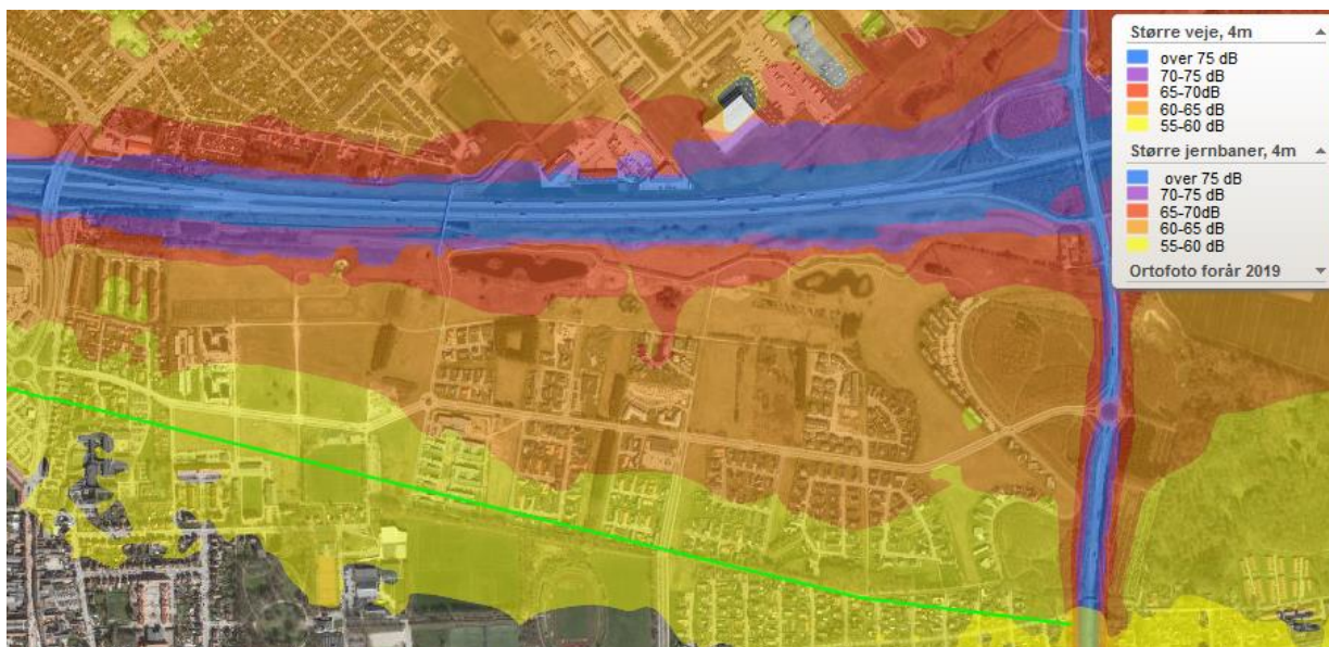
Figur 4: Støjdbredelsen fra motorvejen ved Kaserneområdet. Den grønne streg marker ca. 58 dB.

Der skal udarbejdes en foranalyse for området for at vurdere om det er muligt at forhøje voldene.