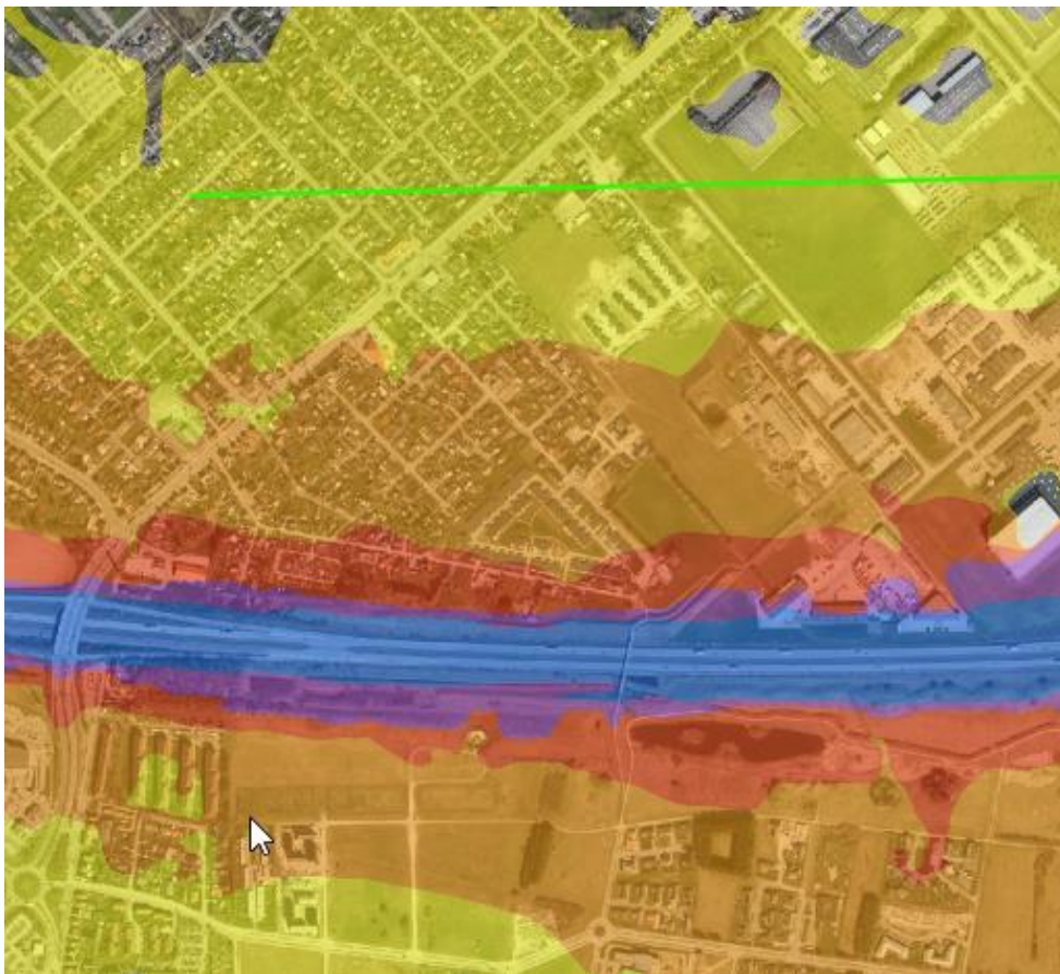
Figur 8: Støjubredelsen fra motorvejen på nordsiden af motorvejen øst for afkørsel 36. Den grønne streg marker ca. 58 dB.

Der skal udarbejdes en foranalyse for området, for at vurdere om det er muligt at forhøje voldene.