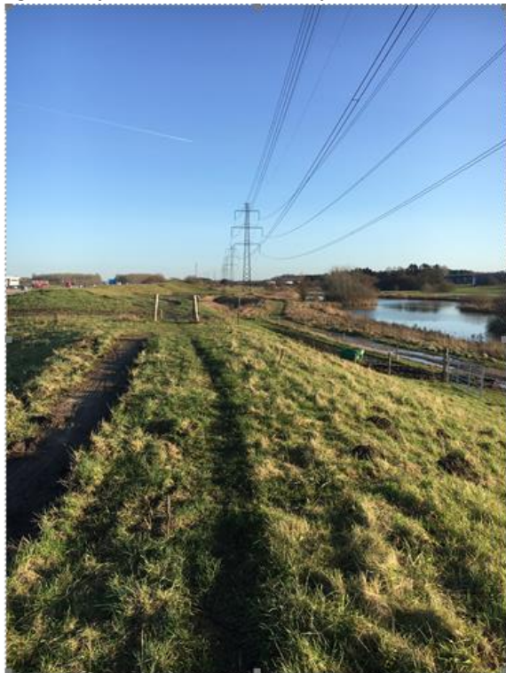
Figur 5: Billede af støjvold ved Kaserneområdet, hvor højspændingsmasterne ses.