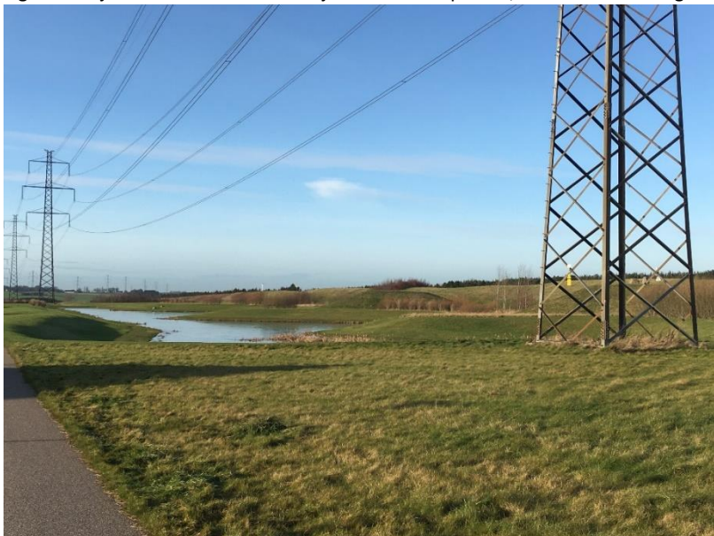
Figur 7: Billede af støjvold ved Klosterparken/Nonnedalen